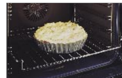
מעמד מדורג מאפשר למשתמש לנצל היטב את שטח התנור. מעמד מדורג חלק מספר 541807