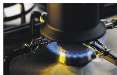
מעמד לסיר קטן (CG602/902 בלבד) אידיאלי לשימוש בפריטים קטנים על הכיריים, כגון פינג'אן קפה. חצובה לסיר קטן חלק מספר 530092