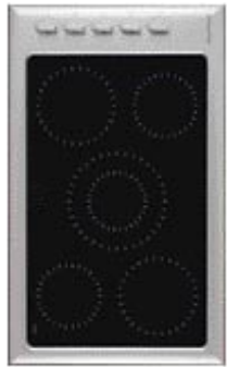
CE901 Titan Ceramic