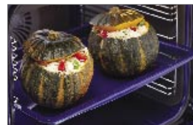
מגש עמוק כלי עמוק זה אידיאלי לצלייה. מגש אפייה עמוק יהלום כחול חלק מספר 541853