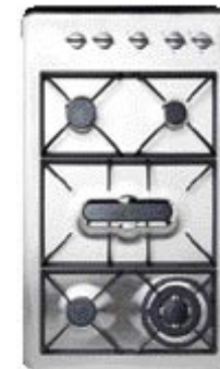
CG902QJET Jet 9