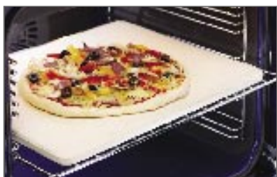
אבן ומרית לפיצה מפיק פיצות פריכות אונטיות בעזרת אבן הפיצה של Fisher & Paykel כולל מרית איכותית מעץ. אבן פיצה חלק מספר 89017