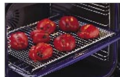
מעמד גריל מתאים למגש העמוק תוספת למעמד חלק מספר 541817