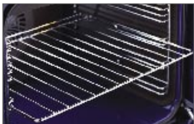
מתלה אפייה מעמד אפייה רשת חלק מספר 447364