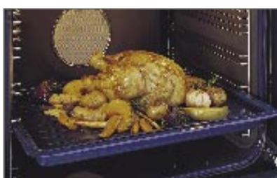
רשת גריל מתאים למגש העמוק. חלק מספר 571644