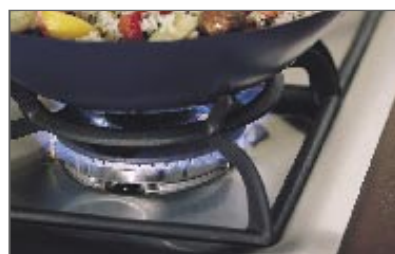
מעמד לווק (CG602/902 בלבד) ייצב את הווק על הכיריים בעזרת מעמד זה המיועד לווק. מספק תמיכה הדרושה לבישול בטוח בווק. חלק מספר 530303