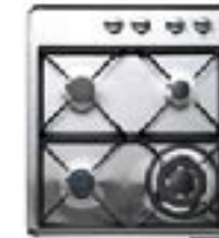
CG602QJET JET 6