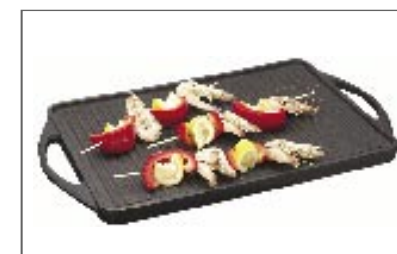
מחבת ברזל יצוק אידיאלי להכנת סטייקים או נתחים גדולים של בשר על כיריים גז. חלק מספר 89049