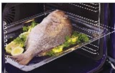
מגש זכוכית מגש זכוכית זה מתאים במיוחד להעברה מהתנור לשולחן תבנית זכוכית למגש חלק מספר 447336