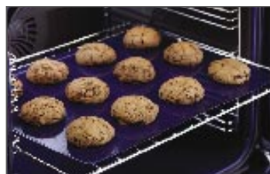
מגש אפייה מגש אפייה שטוח אמייל. חלק מספר 541761