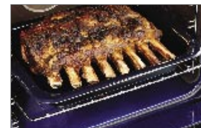
כלי לצלייה להכנת הצלי המושלם. כלי לצלייה אמייל כחול מנומר חלק מספר 573014